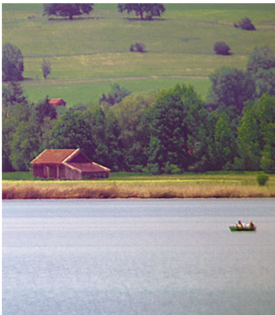
FLÄCHE: gesamt ca. 6 km 2